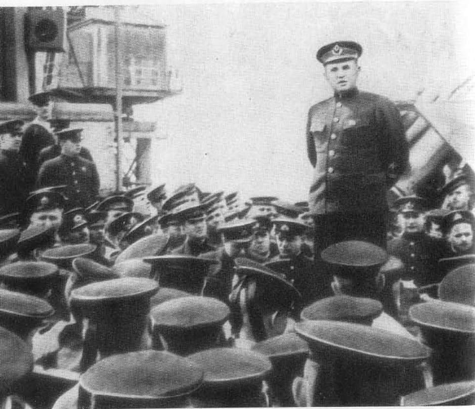
Ф. С. Октябрьский выступает перед моряками.