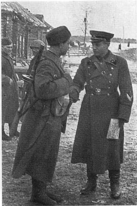
В. И. Казаков в дни боев под Москвой. Деревня Игнатково Московской области, октябрь 1941 г.