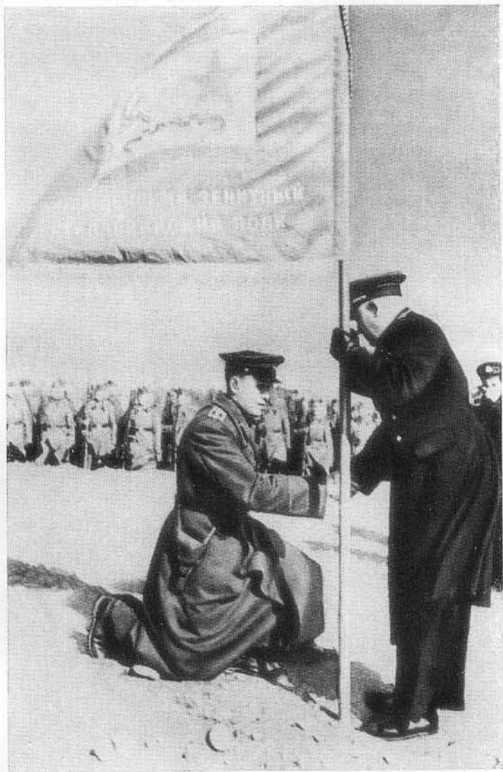
Командующий Черноморским флотом Ф. С. Октябрьский вручает гвардейское знамя командиру 1-го зенитного артиллерийского полка полковнику Семенову.