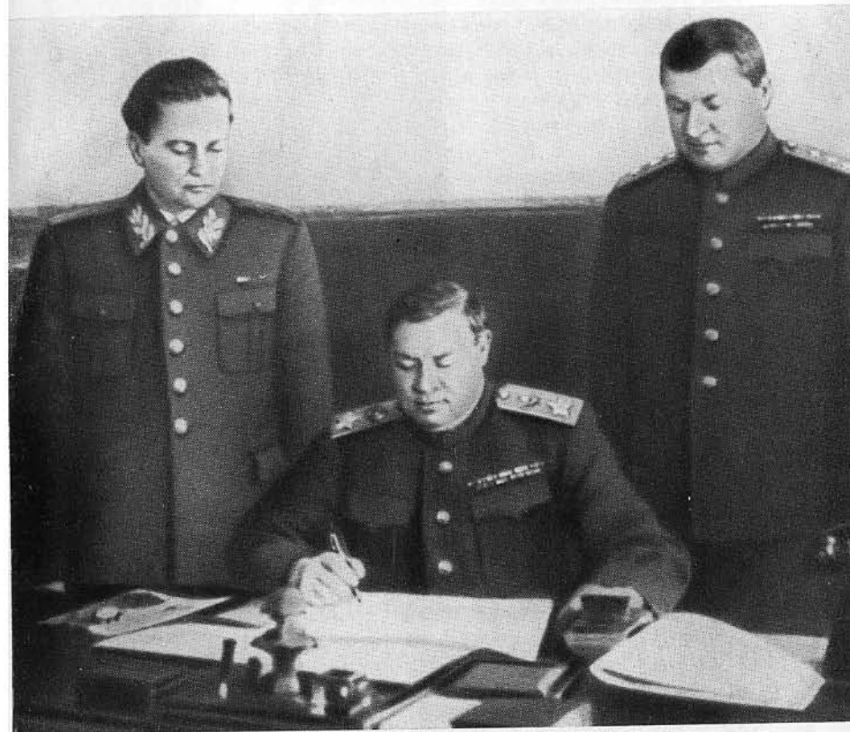
Подписание соглашения между советским командованием и командованием Югославской народно-освободительной армии. Слева направо: И. Броз-Тито, Ф. И. Толбухин, А. С. Желтов. Конец сентября 1944 г.