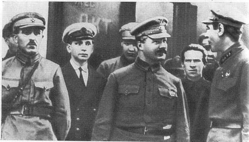
М. В. Фрунзе и Б. М. Шапошников. Ленинград, 1925 г.