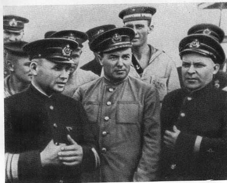
Ф. С. Октябрьский с группой моряков.