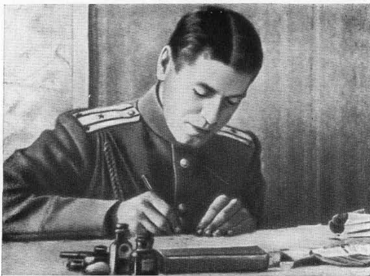
Подполковник Б. М. Шапошников в оперативном отделе Юго-Западного фронта в годы первой мировой войны.