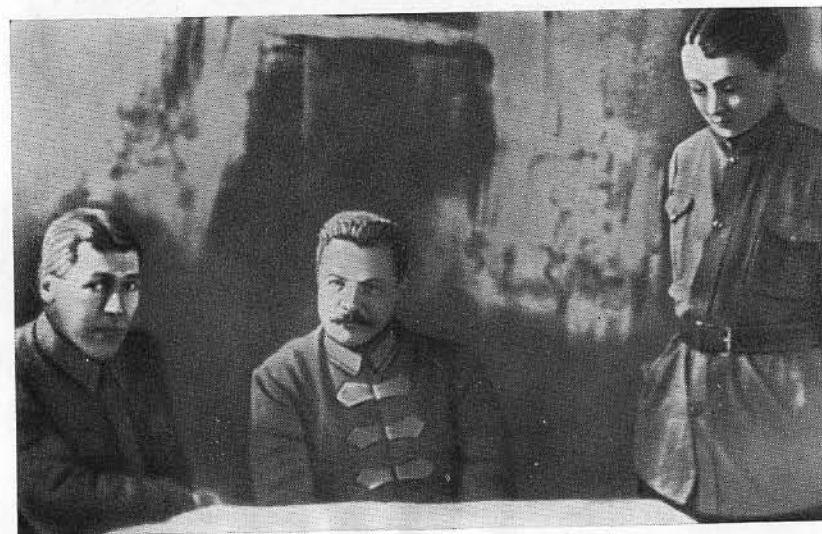
Б. М. Шапошников, М. В. Фрунзе, М. Н. Тухачевский. 1922 г.