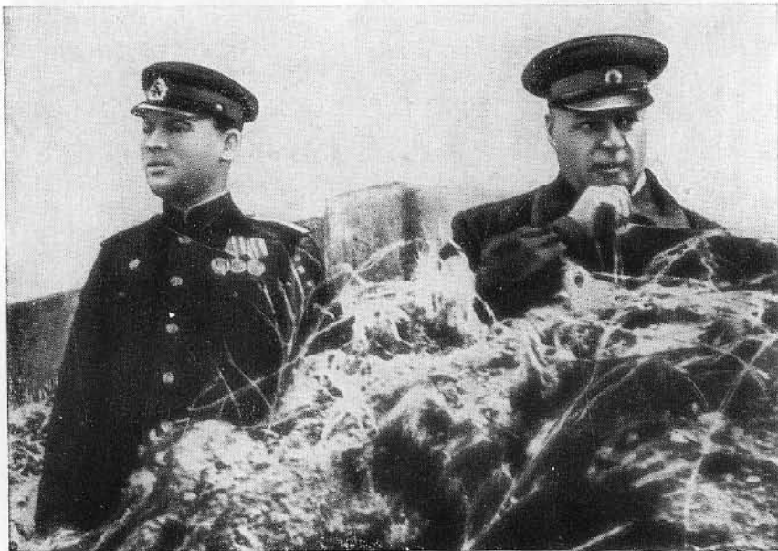
Ф. И. Толбухин на командном пункте. Севастополь, 1944 г.