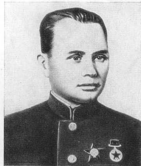
Ф. С. Октябрьский.