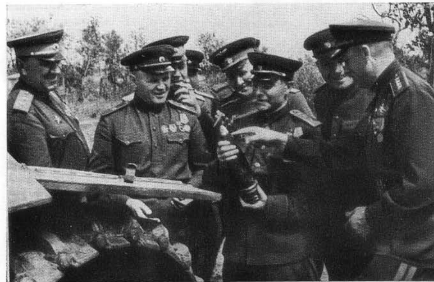
В. И. Казаков и К. К. Рокоссовский рассматривают броневой снаряд.