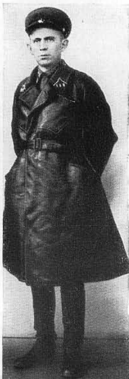
М. С. Громадин. 1939 г.