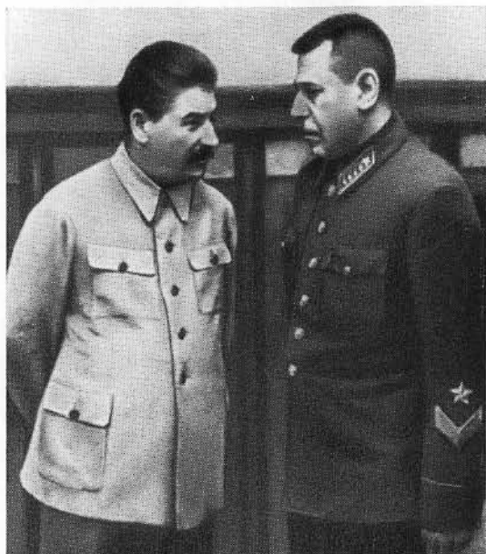
Б. М. Шапошников на докладе у И. В. Сталина. 1938 г.