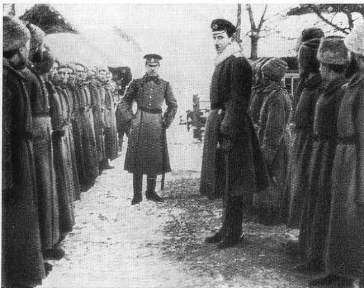
Б. М. Шапошников среди солдат. 1914 г.