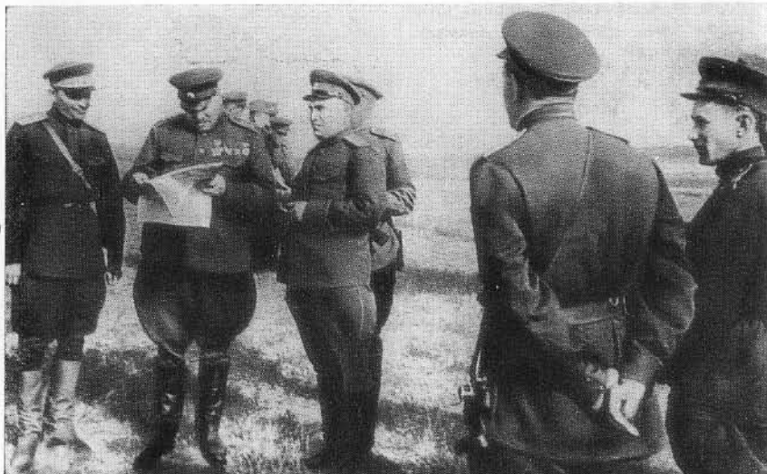
Ф. И. Толбухин и член Военного совета Четвертого Украинского фронта К. А. Гуров (в центре) на Четвертом Украинском фронте. Лето 1943 г.