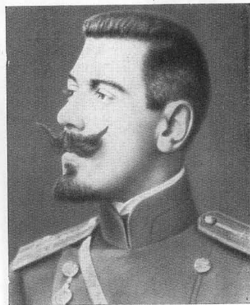
Поручик Б. М. Шапошников. 1907 г.