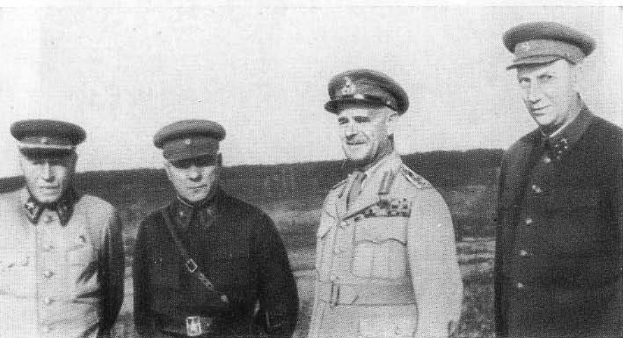
Б. М. Шапошников, К. Е. Ворошилов, Н. Н. Воронов и представитель английской военной миссии на смотре боевой техники Красной Армии. Подмосковье.