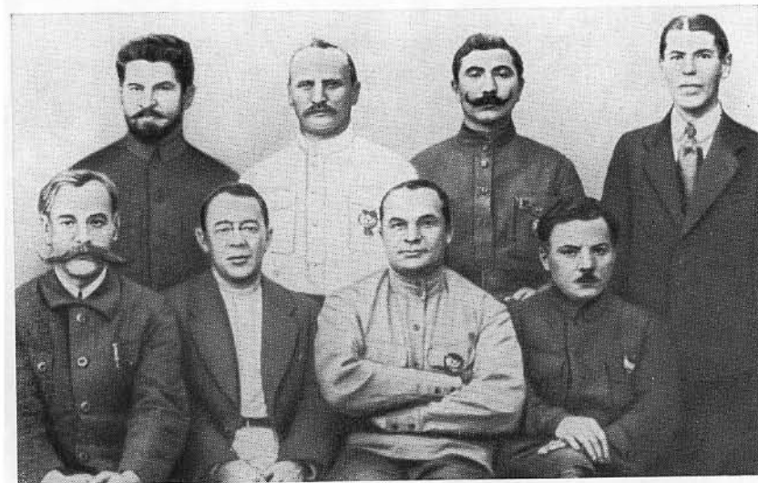
Б. М. Шапошников среди военных деятелей гражданской войны. Сидят (слева направо): главком С. С. Каменев, член Реввоенсовета Республики С. И. Гусев, командующий войсками Юго-Западного фронта А. И. Егоров, член Реввоенсовета Первой Конной армии К. Е. Ворошилов; стоят: начальник Полевого штаба РВСР П. П. Лебедев, начальник штаба Юго-Западного фронта Н. Н. Петин, командующий Первой Конной армией С. М. Буденный, начальник оперативного отдела Полевого штаба РВСР Б. М. Шапошников.