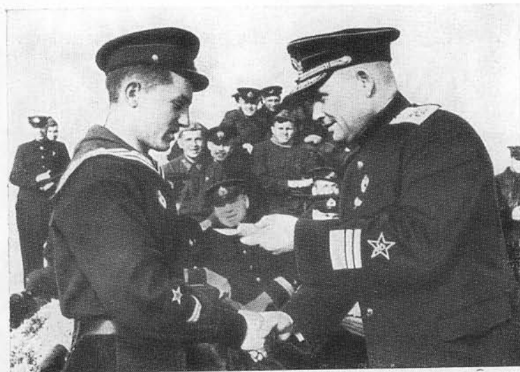
Ф. С. Октябрьский вручает ордена летчикам.