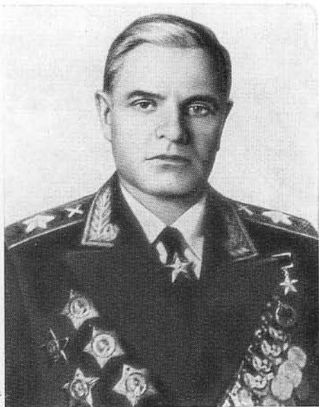
Маршал артиллерии В. И. Казаков.

ка на Кавказ и в Закавказье. Объехать эти районы вынуждала сама обстановка. Развертывая наступление на кавказском направлении, гитлеровцы стремились прежде всего овладеть кавказскими нефтяными источниками СССР, а в случае неудачи уничтожить их, чтобы сорвать снабжение Красной Армии горючим. Наступление их сухопутных войск поддерживалось значительной авиационной группировкой, которая со второй половины 1942 года все более проявляла активность. Только в пределах Закавказья с июля по декабрь было зафиксировано почти 7,5 тысячи самолетов-пролетов.