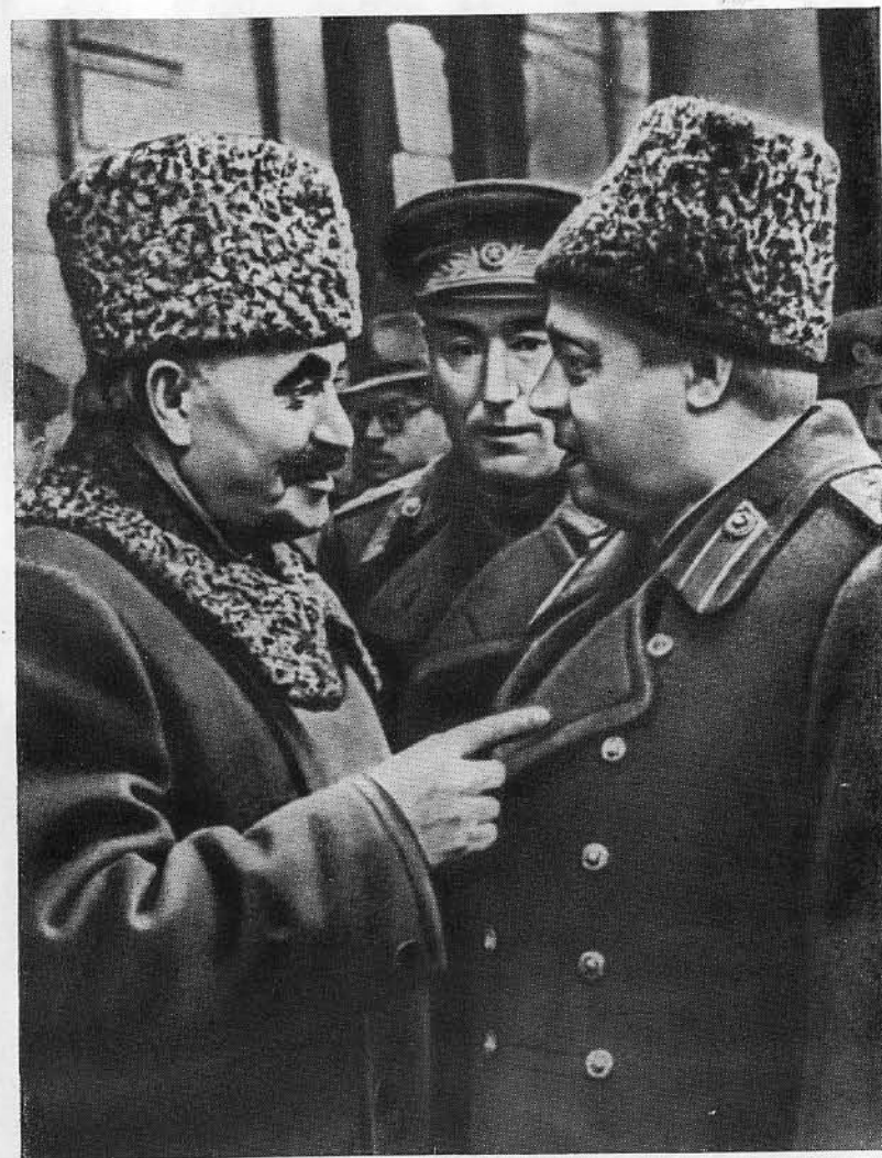
Георгий Димитров, Ф. И. Толбухин, С. С. Бирюзов.