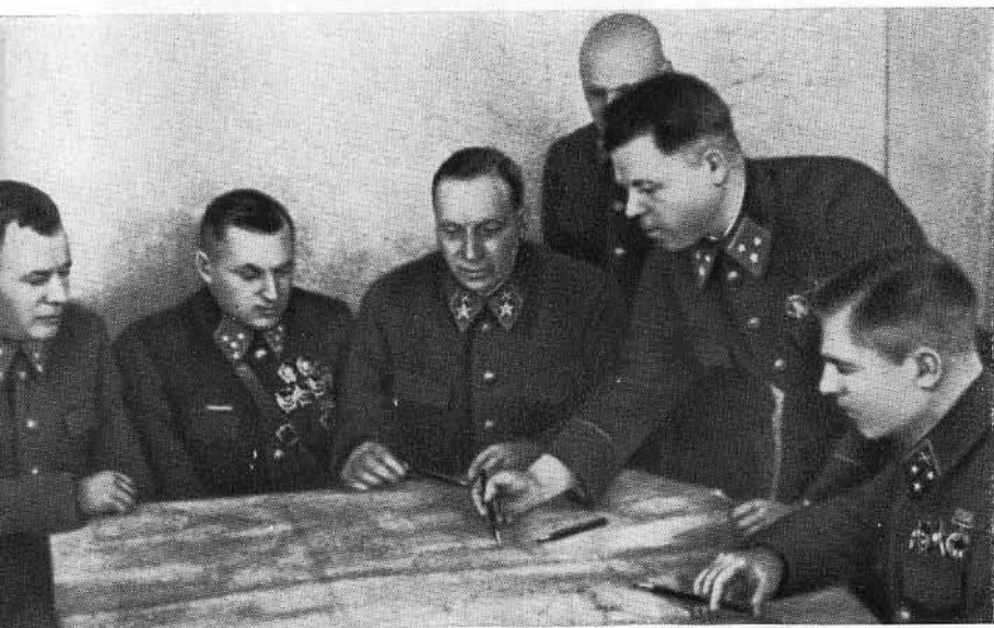
Представитель Ставки Верховного Главнокомандования Н. Н. Воронов и Военный совет Донского фронта за разработкой плана операции. Слева направо: А. А. Новиков, К. К. Рокоссовский, Н. Н. Воронов, К. Ф. Телегин, М. С. Калинин, В. И. Казаков.