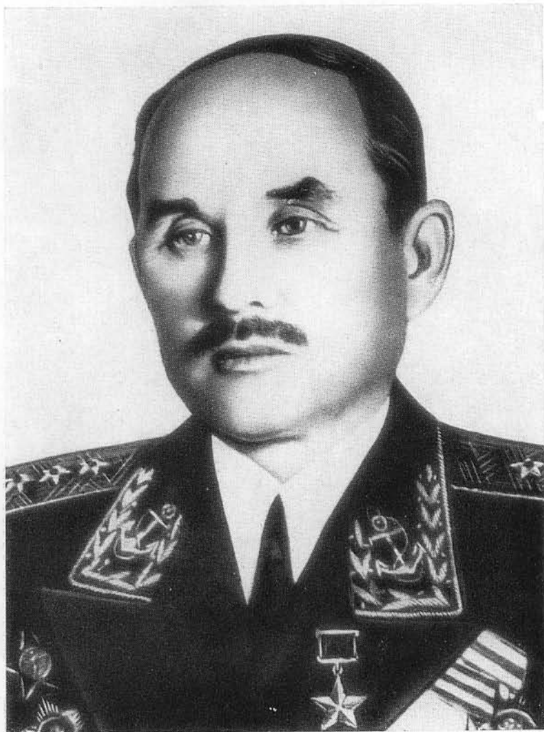
Адмирал Ф. С. Октябрьский.