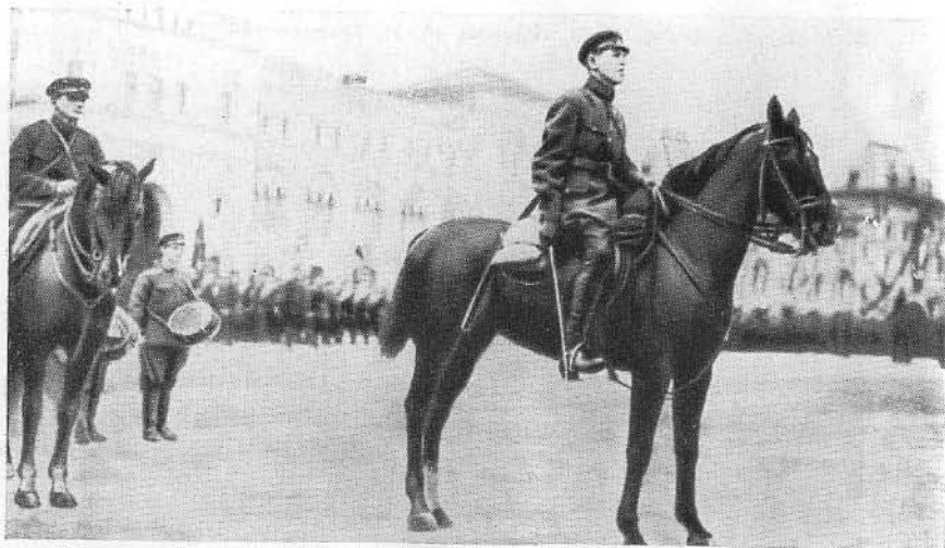
Командующий войсками Московского военного округа на военном параде. Москва, май 1928 г.