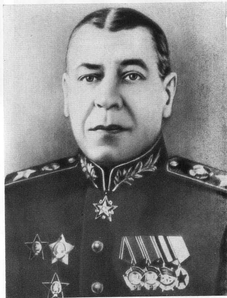
Маршал Советского Союза Б. М. Шапошников.